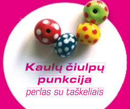
Kaulų čiulpų punkcija perlas su taškeliams