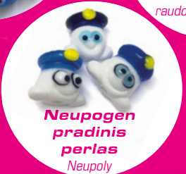
Neupogen pradinis perlas Neupoly