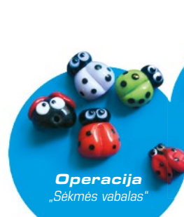
Operacija „Sėkmės vabalas“