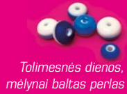
Tolimesnės dienos, mėlynai baltas perlas