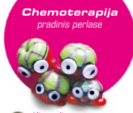
Chemoterapija pradinis perlase