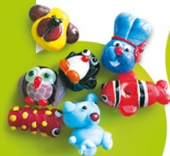
Portos įstatymas perlas su gyvūnu