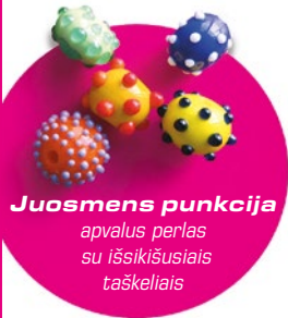
Juosmens punkcija apvalus perlas su išsikišusiais taškeliams