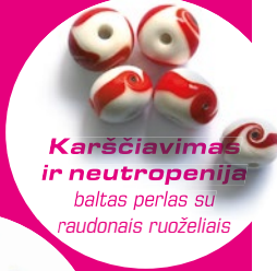
Karščiavimas ir neutropenija baltas perlas su raudonais ruoželiais