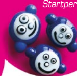
Spindulinė terapija pradinis perlas Startperle