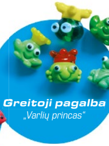
Greitoji pagalba „Varlių princas“