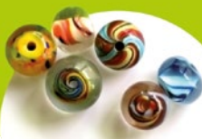
Vaizdavimo procedūra skaidrus perlas su spalvota šerdimi

Įvairios intervencijos tampa „matomos“. Bet kas gali iš grandinėlės matyti, kurioje gydymo stadijoje yra pacientas.