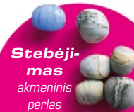
Stebėji- mas akmeninis perlas