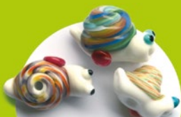
Pirmieji inkaro ir sraigės perlai