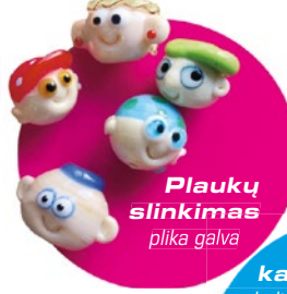
Plaukų slinkimas plika galva