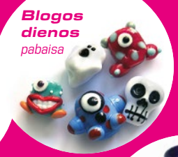
Blogos dienos pabaisa