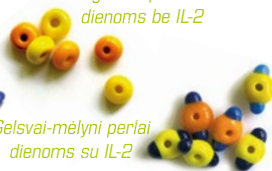
Gelsvai-mėlyni perlai dienoms su IL-2