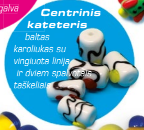
Centrinis kateteris baltas karoliukas su vingiuota linija ir dviem spalvotais taškeliams