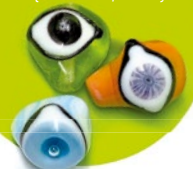
Tvarsčių keitimas balta apvalus perlas